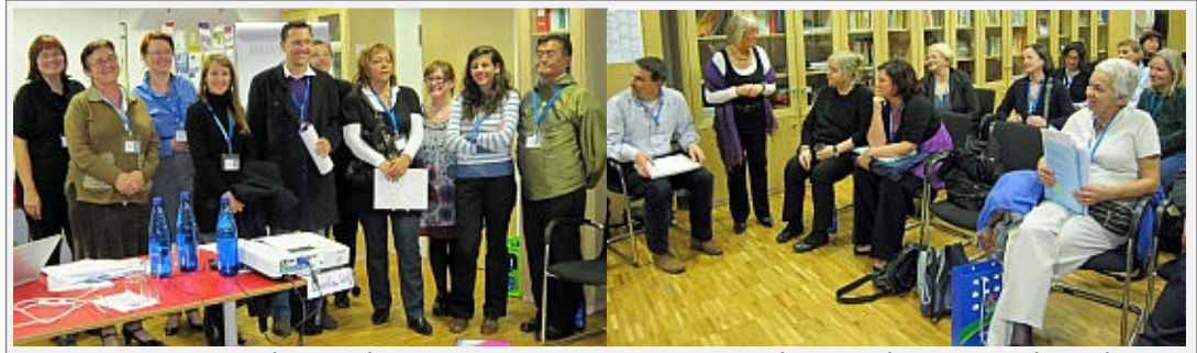
New Committee Members and Contact Persons - Experienced CMs and some Board Members

Cela semble très difficile de trouver des membres actifs impliqués qui prennent une